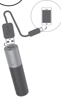
Carregar o dispositivo