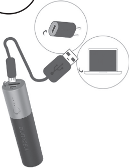
Carregar o PowerBank