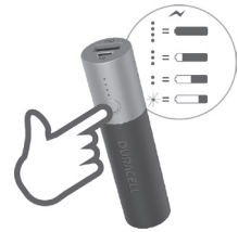
Indicador de Energia/ Bateria